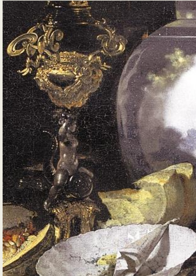
Willem Kalf, Nature morte avec fruits , 17 e siècle, détail