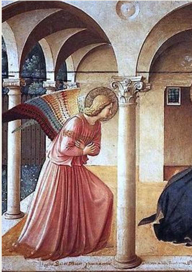
Fra Angelico, Annonciation , 1437, fresque 230 cm × 297 cm, détail