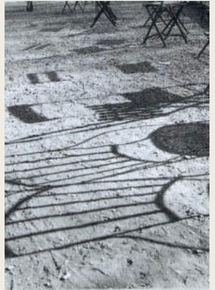
Edouard Boubat, Paris, Jardin du Luxembourg , 1948