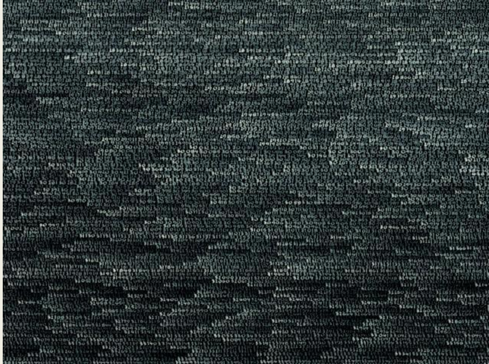
Roman Opalka 1965 / 1 - ∞ , Détail 1-35327, Tempera sur toile