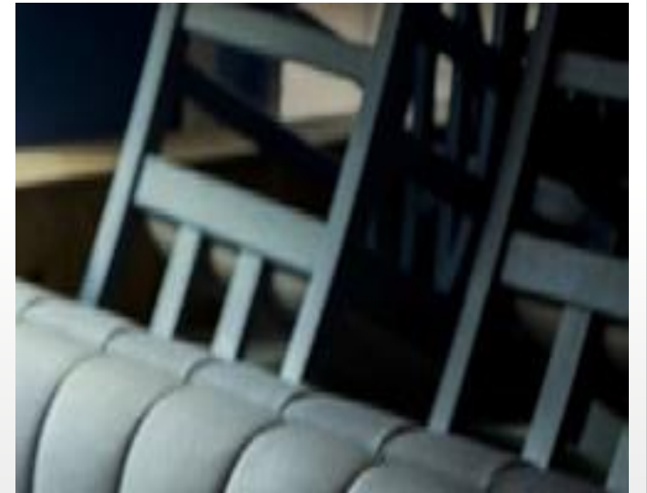
Des chaises renversées sur la table qui rappellent l'absence