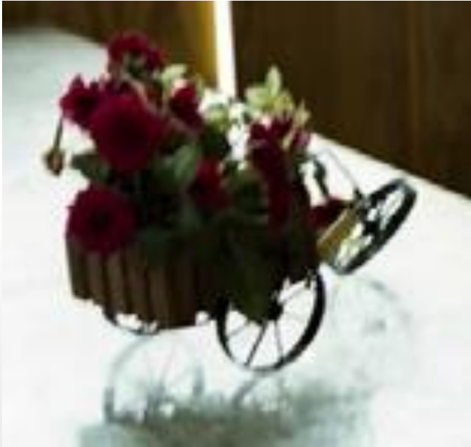
La petite décoration perdue, seule sur la table