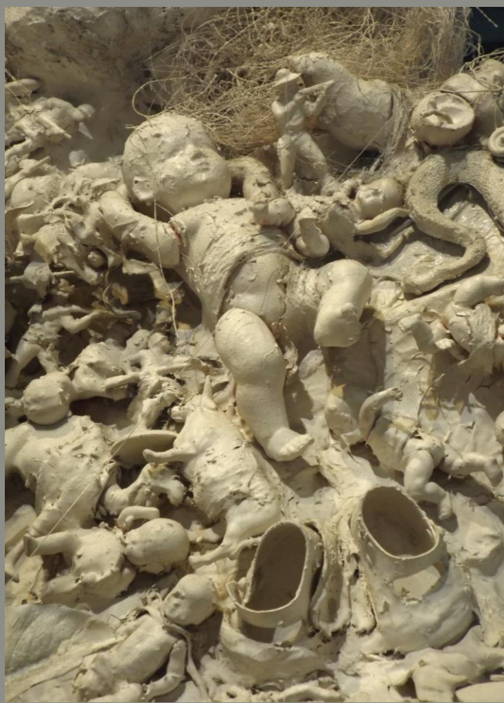
Niki de Saint Phalle, La mariée , 1963, grillage, plâtre et jouets divers, détail.