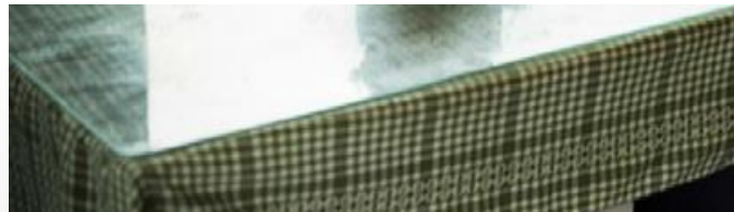
La nappe en plastique d'un autre temps avec sa plaque en verre de protection