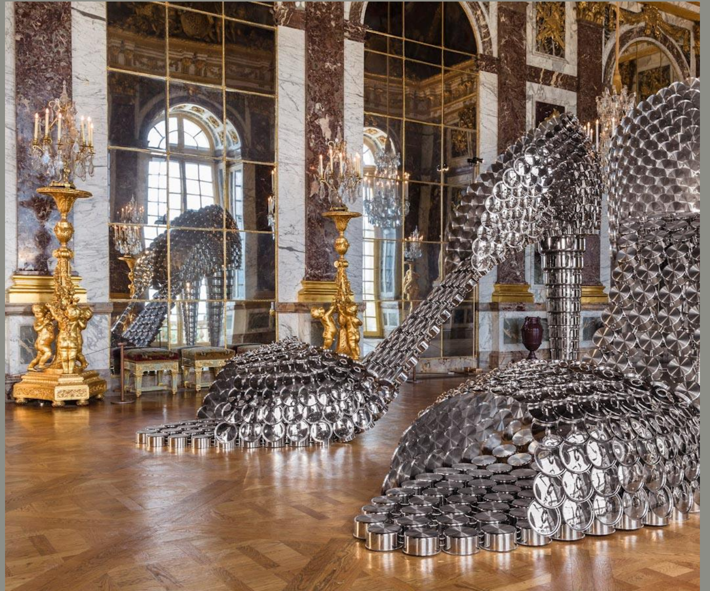
Joana Vasconcelos, Marylin , 2011, casseroles, château de Versailles