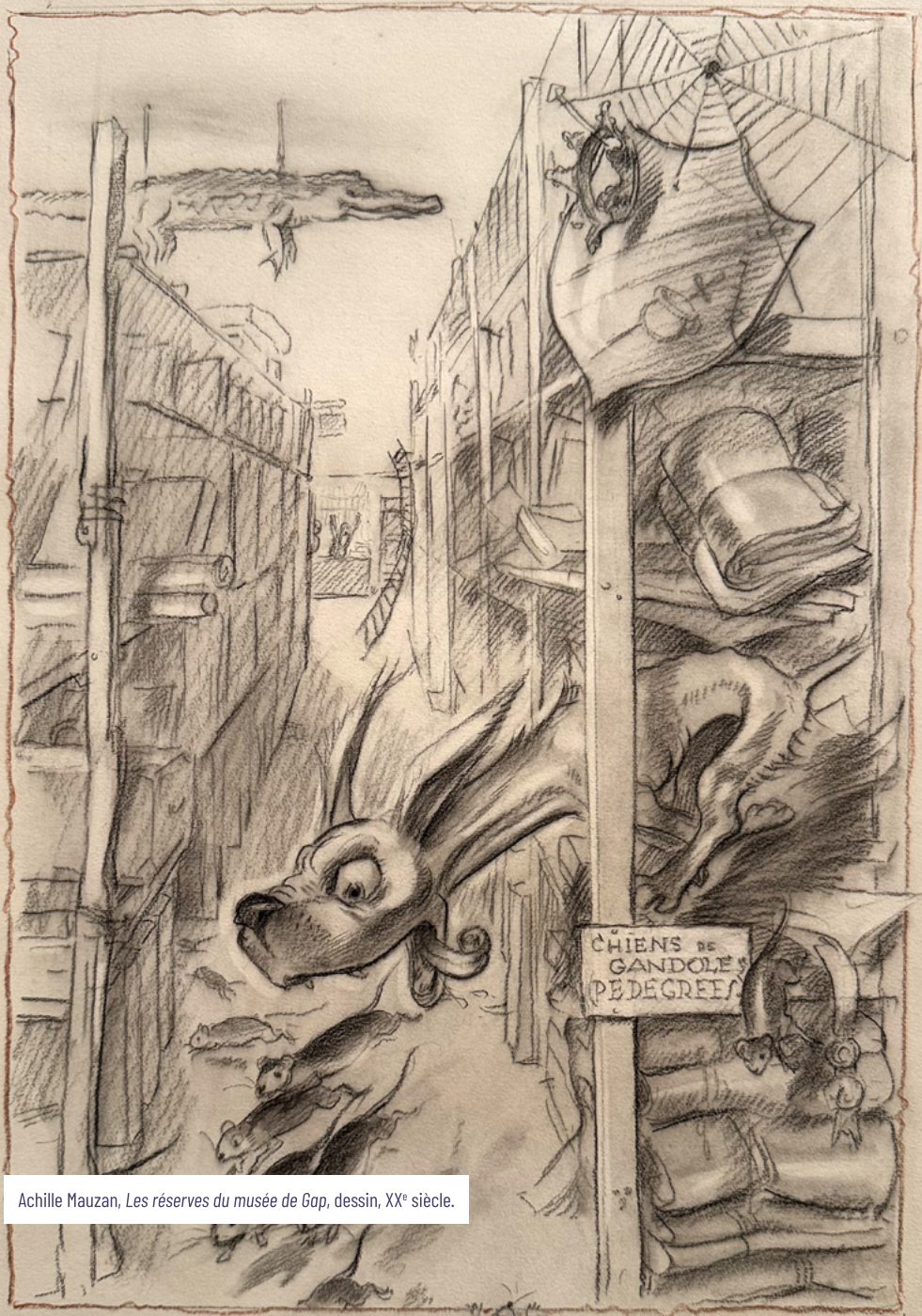
Achille Mauzan, Les réserves du musée de Gap, dessin, XX e siècle.